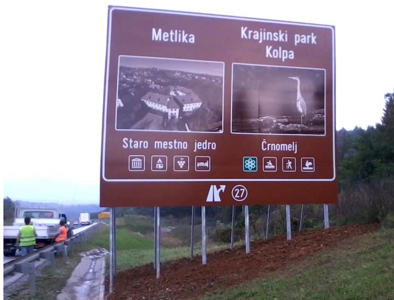
Slika 3: Pred vsakim AC oz. HC izvozom se lahko postavi največ dve obvestilni tabli s po dvema vsebinama

Sledila je nujno potrebna novelacija dokumenta z določitvijo turističnih vsebin za posamezen izvoz. Tokrat se je medresorsko usklajevanje razširilo na kar 10 krovnih institucij s področja turizma in cestnega prometa, in sicer so dokument sooblikovale takratne institucije Ministrstvo za promet, Ministrstvo za kulturo, Ministrstvo za okolje in prostor, Ministrstvo za gospodarstvo, Slovenska turistična organizacija, Turistična zveza Slovenije, Združenje slovenskih žičničarjev, Skupnost slovenskih naravnih