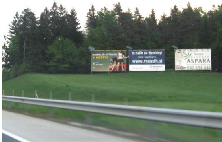
Slika 1: Prenasičenost obcestnega prostora z oglaševalskimi panoji

Za turiste in potencialne turiste, ki se v Slovenijo pripeljejo s cestnim vozilom, predstavlja prvi stik z našo državo cesta in njen obcestni prostor. V veliki večini so to avtoceste in hitre ceste, ki na ta način predstavljajo velik potencial za informiranje voznikov o bližini turističnih destinacij. V to kategorijo ne spadajo veliki oglaševalski panoji, ki s svojimi kričečimi barvami, dostikrat neumestnimi besedili in predvsem neustrezno izbranimi lokacijami postavitev odvrtajo pozornost voznikov od vožnje in s tem ogrožajo prometno varnost. Ne moremo tudi mimo estetskega vidika – oglaševalski panoji agresivno posegajo v obcestni prostor, ki je dostikrat celo agrarno zemljišče... Skrajni čas je, da se zavemo, da cesta vendarle ni medij za oglaševanje!