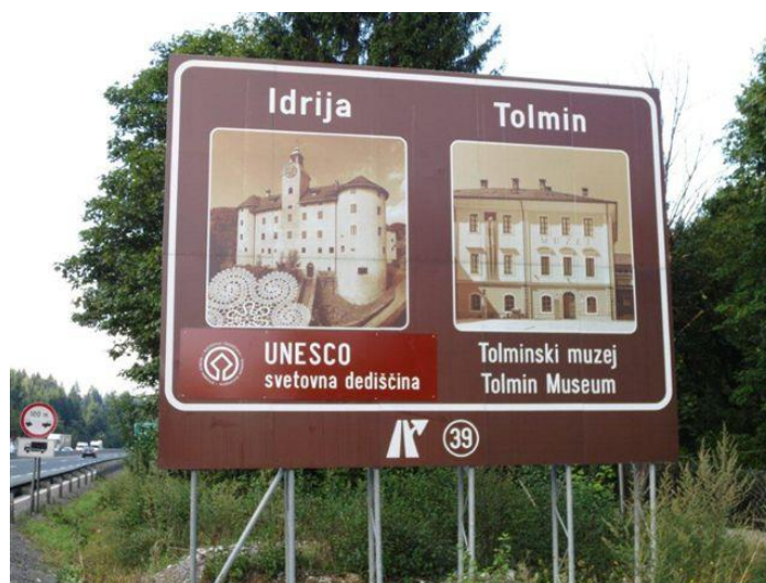
Slika 4: Po dodelitvi statusa svetovne dediščine Unesco je sledila takojšnja označitev Unesco statusa na obstoječi obvestilni tabli

Panoga turizma kot tudi izgradnja avtocest in hitrih cest sta živa sistema, zato je še vedno potrebno aktivno sodelovanje med posameznimi krovni institucijami. Usklajevanja tako potekajo za vsak predlog, ki ga upravljavec avtocest in hitrih cest prejme v obravnavo.