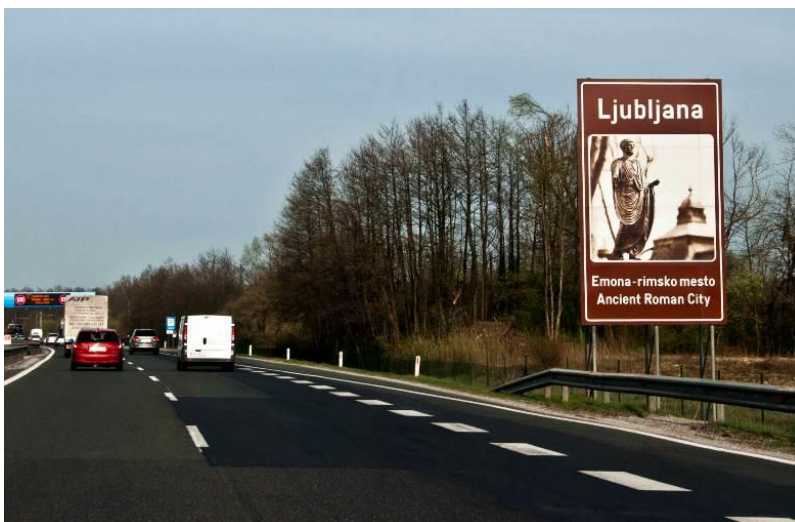
Slika 2: Obvestila tabla spada med prometno signalizacijo

Osnovna funkcija obvestilnih tabel je obveščanje o kulturnih spomenikih, varovanih območjih narave ter pomembnejših turističnih znamenitostih, ki se nahajajo v bližini. Če se osredotočimo na avtoceste in hitre ceste, kjer je potencial turistov največji, potem se po pravilniku na obvestilne table lahko umestijo le turistične vsebine najvišjega nacionalnega pomena: državni kulturni spomeniki, naravne vrednote državnega pomena, državna zavarovana območja in turistične znamenitosti. Med turistične znamenitosti po pravilniku sodijo naravna zdravilišča in smučišča, katerih dolžina prog je 10 km in več ali zmogljivost žičniških naprav 5000 smučarjev na uro in več.